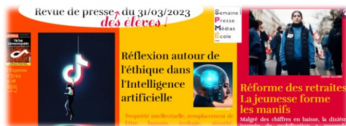
Revue de presse du 31 mars 2023

La revue de presse de la semaine du 31 mars est réalisée avec les élèves de première spécialité HGGSP (Histoire-Géographie, Géopolitique et Sciences Politiques) dans le cadre de la Semaine de la presse. Une réflexion est en cours pour la mise en place d'un partenariat afin que ces élèves puissent avoir la charge de cette revue de presse l'année prochaine.